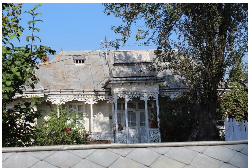
Casă tradițională comuna Păstrăveni

Județul Neamț încă mai deține un patrimoniu arhitectural tradițional bogat și diversificat, deși acesta este supus permanent agresiunilor din exterior, precum: