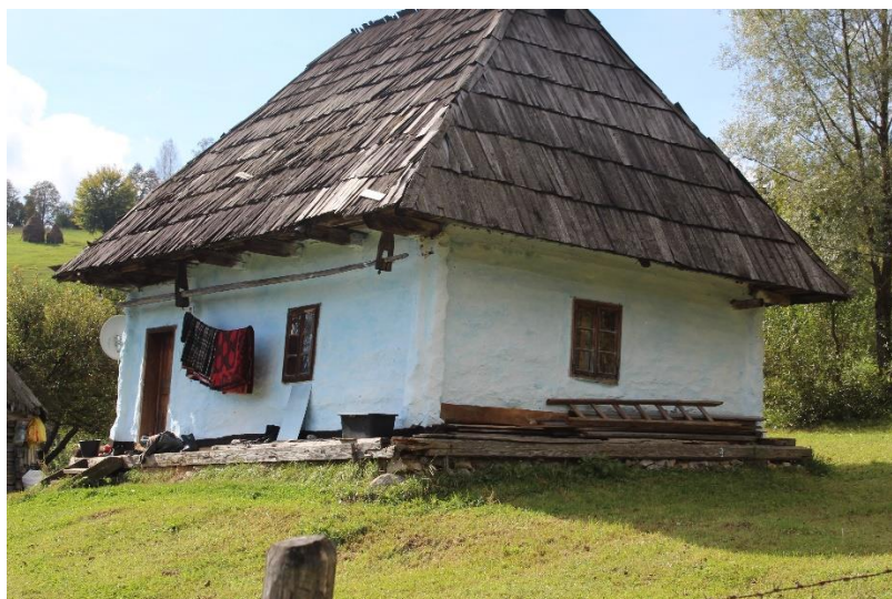
Casă tradițională comuna Bicaz-Chei

Există o componentă a patrimoniului cultural imaterial care poate genera dezvoltare economică: conservarea și perpetuarea arhitecturii tradiționale. Încă din anul 2015, o parte din arhitecții români au semnalat faptul că în satele din România se construiește haotic, importându-se modele, materiale și tehnici din străinătate, care nu se potrivesc specificului local. Locuința tradițională românească nu e cu nimic mai prejos decât modelele noi, ea este realizată folosind resursele naturale proprii, de către meșteri locali, cu utilizarea unor tehnici tradiționale, este în același timp o creație artistică (prin prisma decorurilor ornamentale folosite, rezultat al credințelor, sentimentelor, nivelului de cunoaștere atins la un moment dat și al creativității locuitorilor). Ea se află de fapt la granița dintre material și imaterial.